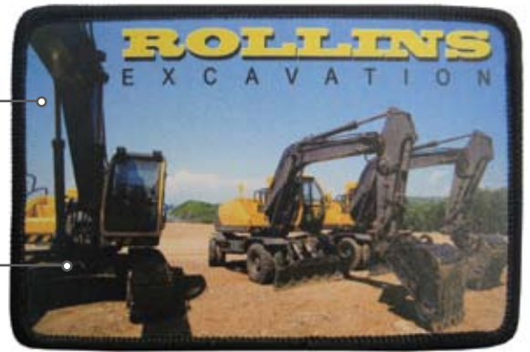
PHOTO- REALISTIC IMAGES

HIGH RESOLUTION PRINTING IMPRESSION À HAUTE RÉOLUTION